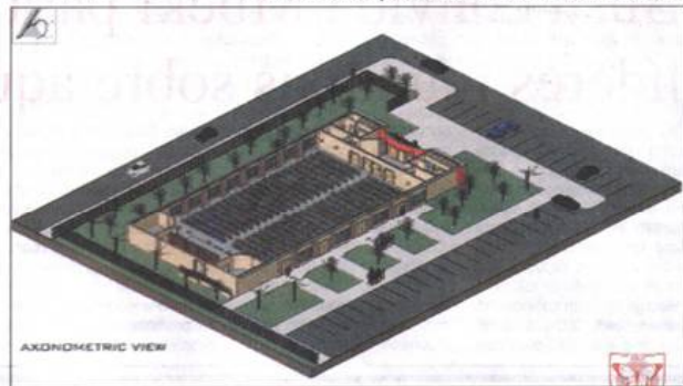
NA GRAVURA DE CIMA, VISTA PANORÂMICA DO SALÃO COMUNITÁRIO NA ESCOLA PRIMÁRIA DE KLIPSPRUIT WEST; EM BAIXO, DESENHO DO INTERIOR QUANDO FICAR PRONTO, COM CAPACIDADE PARA 1.000 PESSOAS SENTADAS